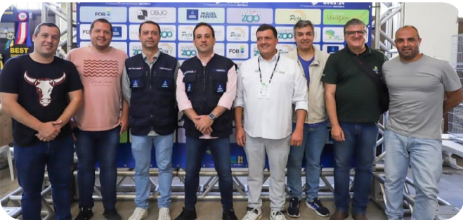
Autoridades municipais e diretores da FOB