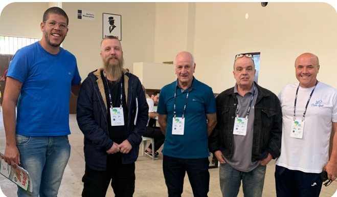
Criadores e juizes de Periquitos