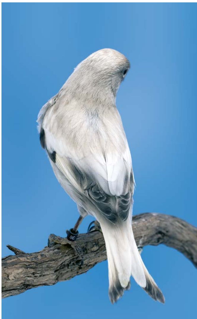
Negro Pérola Branco Dominante