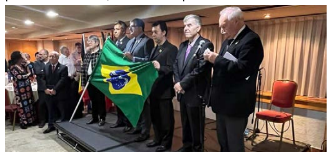
Representantes da FOB durante o jantar de encerramento