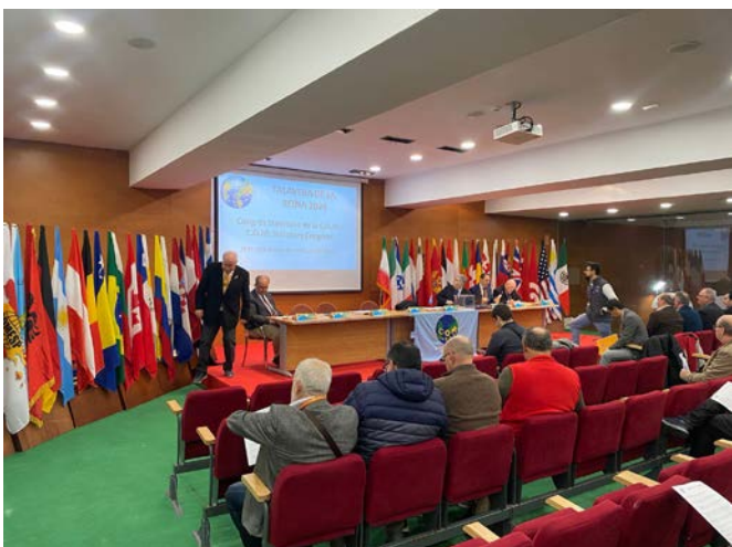
O salão que recebeu o Congresso da COM, que contou com a presença de 31 países