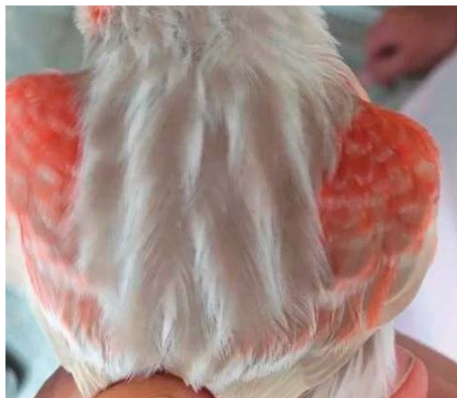
Bruno Satiné mosaico rosso maschio